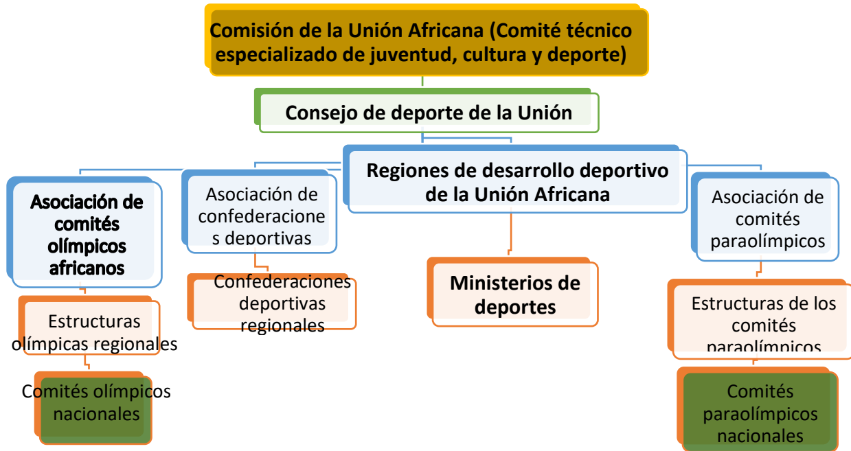
Figura 2. Estructura deportiva de la Unión Africana